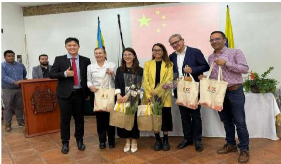
Ilustración V. Feria Expofusa 2025

En julio de 2025, la Asociación acompañó a la empresa Shanying Automotive en el lanzamiento oficial en Colombia de los vehículos eléctricos FAW Bestune