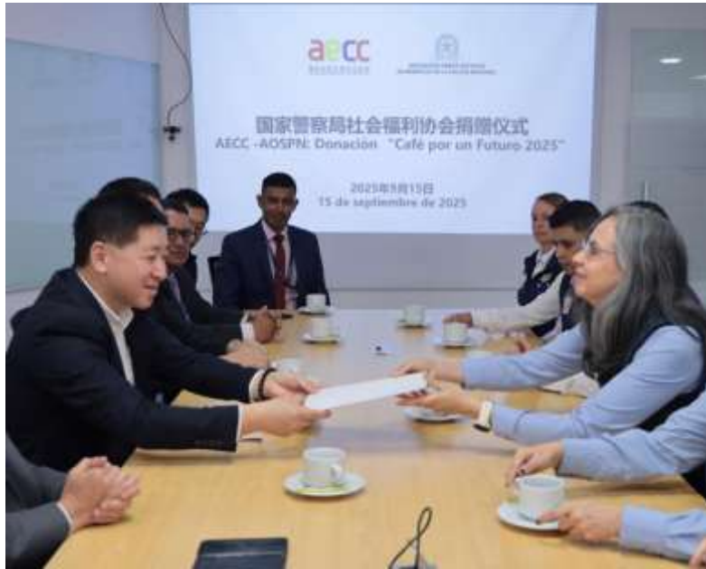
Ilustración XII. Café por un Futuro 2025 – Policía Nacional