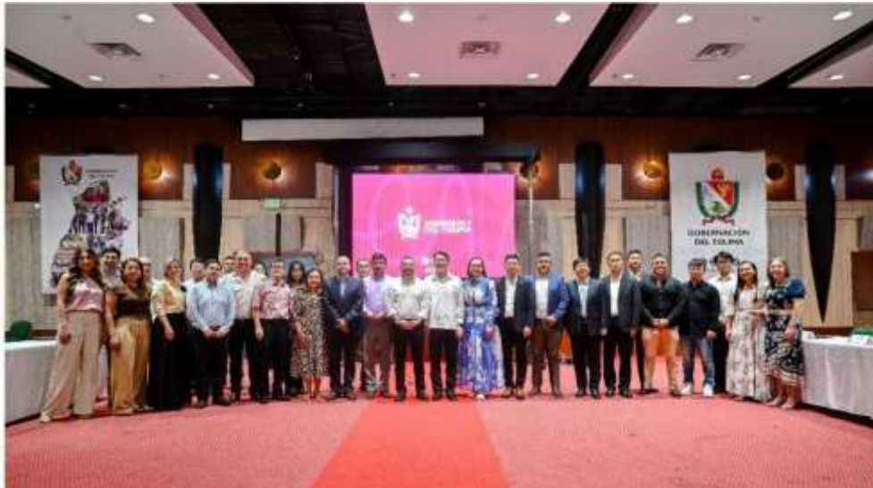
Ilustración I. Intercambio económico y comercial en Ibagué

suscribió un Memorándum de Entendimiento (MOU) con la Cámara de Inversión y Comercio Colombo China, orientado al desarrollo de acciones conjuntas para promover oportunidades comerciales, académicas y culturales entre empresas colombianas y chinas.