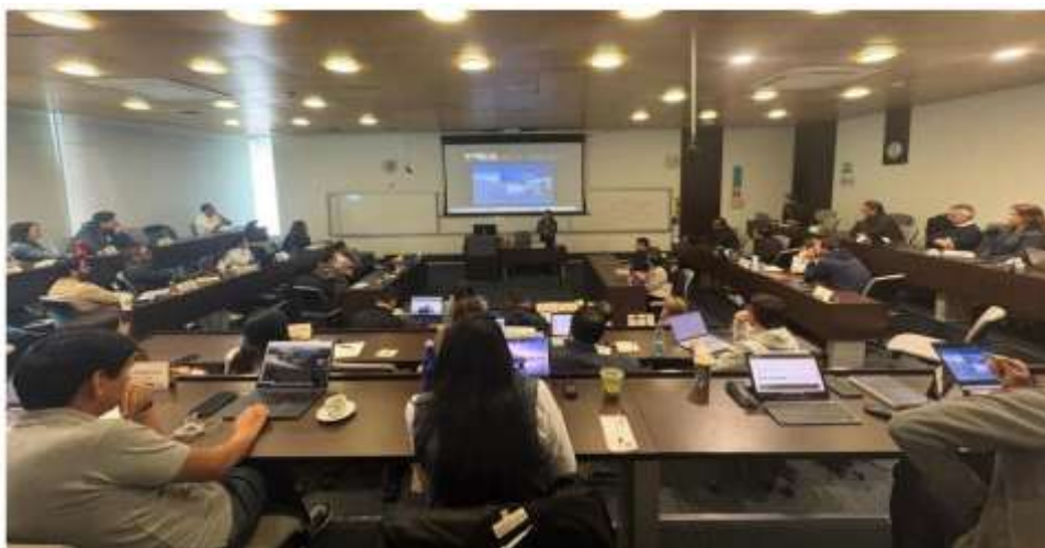
Ilustración III. Empresarios en el Campus - Universidad de los Andes

sectores relacionados con infraestructura, logística y energías renovables. En marzo de 2025, la Asociación fortaleció sus relaciones con instituciones académicas mediante el programa “Empresarios en el Campus”, desarrollado conjuntamente con la Universidad de los Andes y otras instituciones educativas. En esta primera edición participó la empresa afiliada BYD Colombia, presentando avances y tendencias relacionadas con vehículos de nueva energía, movilidad sostenible e innovación tecnológica.