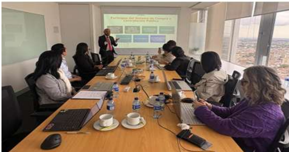
Ilustración XI. Capacitación sobre Plataforma SECOP II – ANCP

Durante este mismo mes, la Asociación promovió espacios de capacitación empresarial y responsabilidad social mediante el desarrollo, junto con la Agencia Nacional de Contratación Pública (ANCP), de un ciclo de capacitaciones sobre SECOP II y contratación pública dirigido a empresas extranjeras.