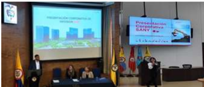
Ilustración XV. Semana de la Cultura China - Hikvision y SANY Heavy Industry

Durante este mismo periodo. la Asociación desarrolló un encuentro institucional con la DIAN para abordar temas tributarios, aduaneros y de facilitación comercial junto con empresas afiliadas.