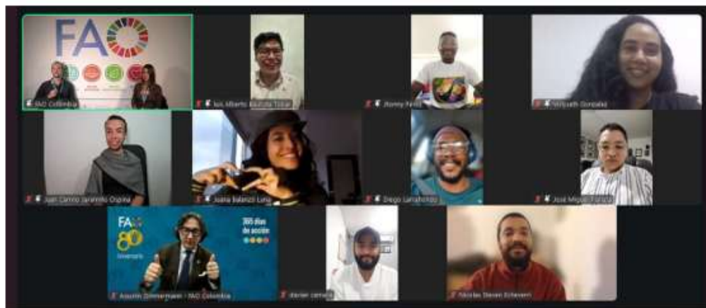
Ilustración XXI. FAO Concurso Nacional de Fotografía 2025 "Somos de la Tierra"