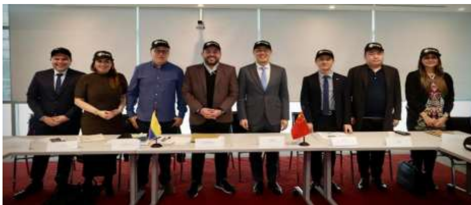
Ilustración VIII. Diálogo AECC – Ministerio de Minas y Energía

el Ministerio de Transporte, enfocado en proyectos de infraestructura, movilidad eléctrica y transporte ferroviario, con la participación de más de treinta empresas chinas. De igual manera, participó en un diálogo institucional organizado por el Ministerio de Minas y Energía relacionado con proyectos de energía solar, energía eólica y transición energética en el marco de la Iniciativa de la Franja y la Ruta. Además, participo en la gala “Noche de China”, celebrada en el Parque Bolívar de Bogotá, evento organizado por la Embajada China en Colombia y el IDR. El evento, enmarcado en la designación de China como país invitado de honor del 28° Festival de Verano, reunió expresiones culturales como artes marciales, danzas tradicionales, música y medicina china, fortaleciendo los lazos culturales y de cooperación entre ambos países.