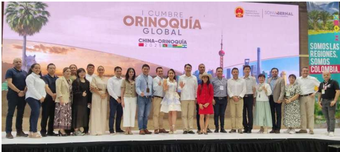
Ilustración XIII. Primera Cumbre China–Orinoquía

Durante octubre de 2025, la Asociación continuó fortaleciendo sus actividades académicas, empresariales y culturales. En una nueva edición del programa “Empresarios en el Campus”, desarrollada en la Universidad Jorge Tadeo Lozano, participó Alibaba abordando temas relacionados con comercio electrónico, logística, e-commerce y expansión internacional. Asimismo, la Asociación participó en la “Semana de la Cultura China” organizada por la Universidad Militar Nueva Granada, mediante conferencias desarrolladas por Hikvision y SANY Heavy Industry sobre innovación tecnológica, inteligencia artificial e infraestructura.