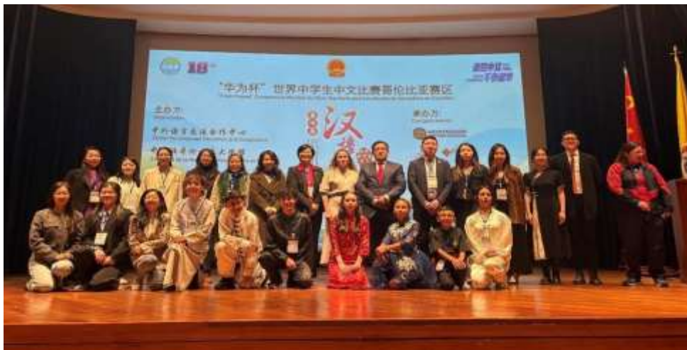
Ilustración IV. Competencia “Ponte Chino” 2025 en Colombia

apertura de la Feria Expofusa 2025, con la representación de empresas afiliadas como BYD Colombia y Shanying Automotive, promoviendo iniciativas relacionadas con movilidad sostenible y desarrollo empresarial. Durante junio de 2025, la Asociación desarrolló una nueva edición del programa “Empresarios en el Campus”, con la participación de CRRC Changchun Railway Vehicles Co., Ltd. – Sucursal Colombia, empresa que presentó experiencias y avances relacionados con desarrollo ferroviario, infraestructura y transporte sostenible, fortaleciendo los espacios de intercambio académico y empresarial entre Colombia y China.