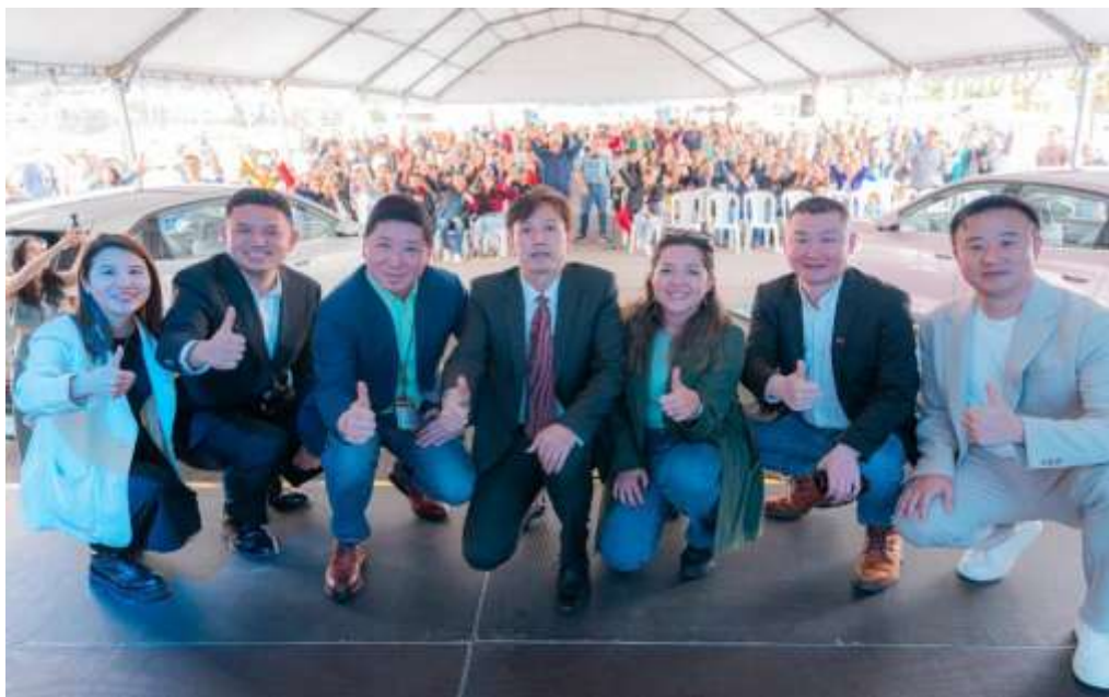
Ilustración VII. Ceremonia de Lanzamiento FAW Bestune

Durante agosto de 2025, la Asociación participó en diferentes espacios de cooperación institucional y fortalecimiento empresarial. En articulación con la Policía Nacional, se desarrolló una jornada de capacitación enfocada en prevención de riesgos, secuestro y extorsión. Asimismo, la Asociación participó junto con la Embajada de China en Colombia en un encuentro empresarial con