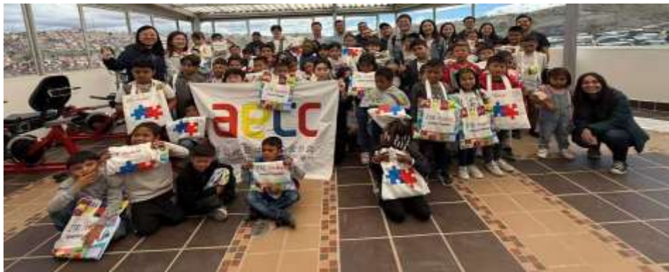
Ilustración XVII. Jornada solidaria de la AECC en Bogotá

En materia de responsabilidad social empresarial, la Asociación organizó además una jornada solidaria en el Centro San Benito Menni, en Bogotá, con la participación de empresas afiliadas como ZTE, CHEC y SANY Heavy Industry, realizando la entrega de materiales escolares y artículos de primera necesidad a estudiantes de escasos recursos.