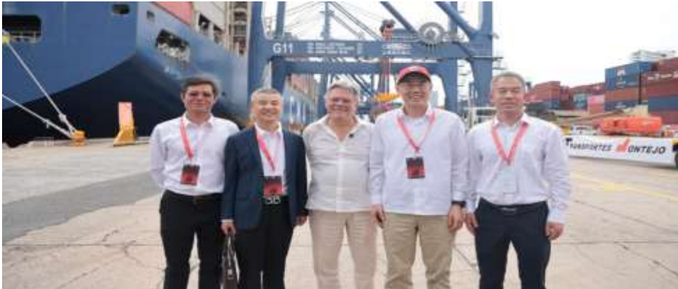
Ilustración X. Proyecto Metro de Bogotá Línea 1 – Llegada del Primer Tren

infraestructura, movilidad sostenible e innovación tecnológica.