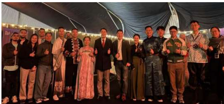
Ilustración IX. “Noche de China” Festival de Verano de Bogotá

En septiembre de 2025 se presentó uno de los acontecimientos más relevantes del año con la llegada al puerto de Cartagena del primer tren de la Línea 1 del Metro de Bogotá, proyecto liderado por China Harbour Engineering Company (CHEC), empresa afiliada y presidenta de la Asociación, constituyéndose en un importante avance en materia de cooperación colombo-china en