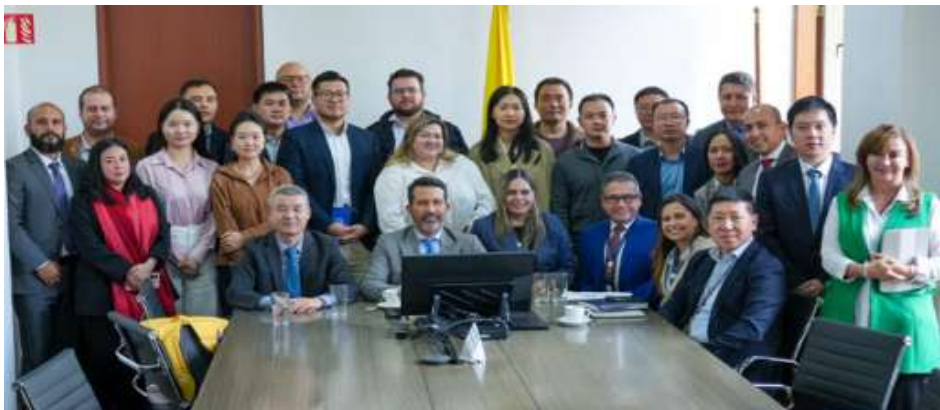
Ilustración XVI. Encuentro AECC – DIAN

Durante este mismo periodo. la Asociación desarrolló un encuentro institucional con la DIAN para abordar temas tributarios, aduaneros y de facilitación comercial junto con empresas afiliadas.