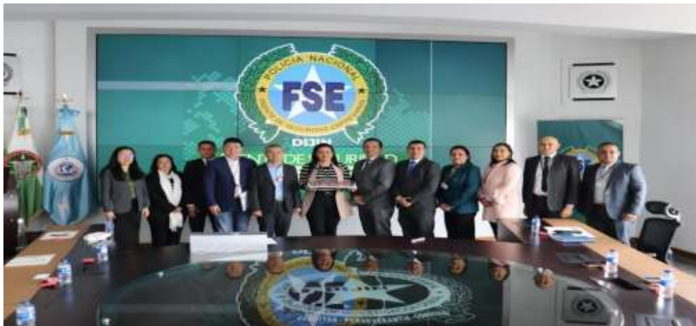
Ilustración VI. Alianza AECC – Frente de Seguridad Empresarial Policía Nacional

“Xiao Ma” y del modelo Yueyi 03 (JOY 03), apoyando iniciativas relacionadas con movilidad eléctrica y transición energética. Durante este mismo mes, la Asociación formalizó su vinculación al Frente de Seguridad Empresarial de la Policía Nacional, fortaleciendo los mecanismos de cooperación institucional y prevención en materia de seguridad para las empresas afiliadas.