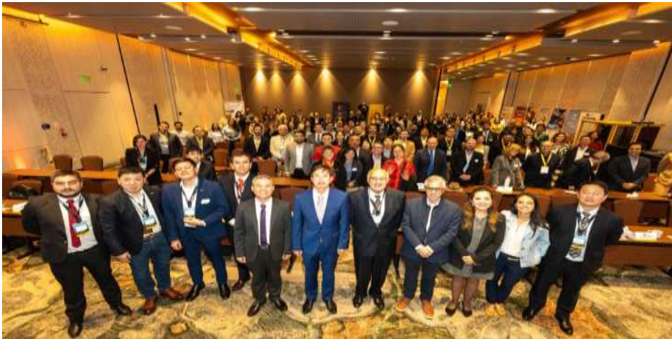
Ilustración XIX. Diálogo China–Colombia “la Franja y la Ruta”

Finalmente, durante diciembre de 2025, la Asociación participó activamente en el IX Diálogo China–Colombia “La Franja y la Ruta”, realizado junto con la Embajada de China en Colombia y la Cámara de Inversión y Comercio Colombo China, abordando temas estratégicos relacionados con infraestructura, energía, comercio, inversión, innovación tecnológica y cooperación empresarial, con participación de empresas afiliadas como Huawei, BYD, Alibaba Cloud, China Energy Engineering Company, Power China y COSCO Shipping.