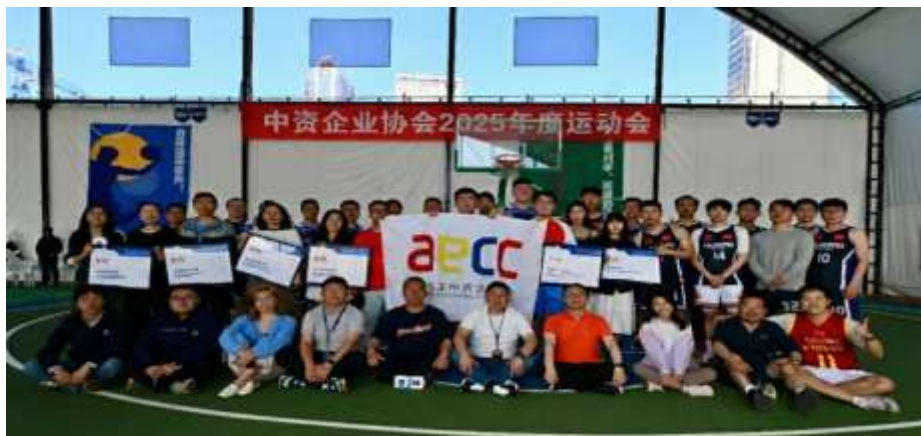
Ilustración XX. Olimpiadas de la Asociación de Empresas Chinas

Durante este mismo mes, la Asociación promovió actividades de integración empresarial, cultural y deportiva, destacándose las Olimpiadas de Empresas Chinas y la participación como patrocinador en el Concurso Nacional de Fotografía FAO 2025 “Somos de la Tierra”. Asimismo, sostuvo una reunión de cooperación con Asocapitales para analizar oportunidades conjuntas en infraestructura, cultura, turismo y transporte regional, reafirmando su compromiso con el fortalecimiento de la cooperación bilateral, el desarrollo empresarial y la integración entre Colombia y China.