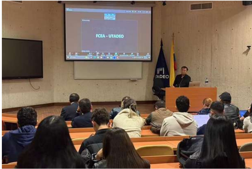
Ilustración XIV. Empresarios al Campus Utadeo – Alibaba