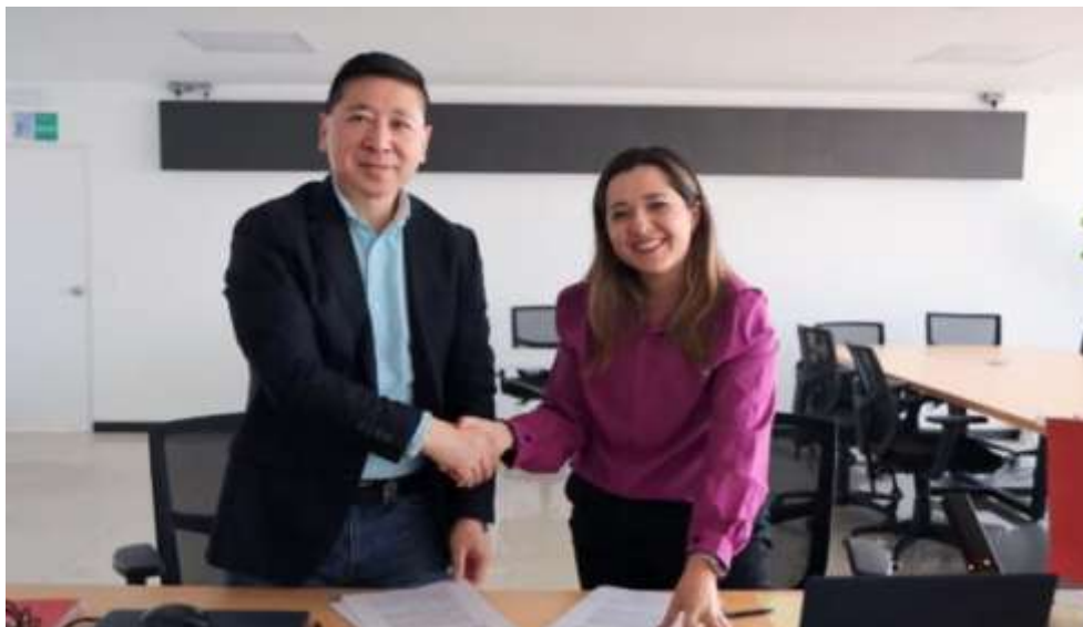
Ilustración II. Memorándum de entendimiento (MOU) – Cámara de Inversión y Comercio Colombo China

Durante febrero de 2025, la Asociación participó junto con la Embajada de China en Colombia en una reunión de alto nivel con la RAP Pacífico, integrada por los departamentos de Chocó, Valle del Cauca, Cauca y Nariño, con el propósito de avanzar en la construcción de un Memorando de Entendimiento con delegaciones de empresas chinas. Este encuentro permitió identificar oportunidades regionales de inversión, cooperación y desarrollo sostenible en